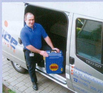
So funktioniert der Geldtransport bei All Service.